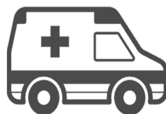
きゅうきゅうしゃ